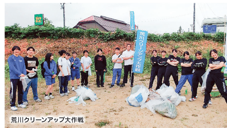
荒川クリーンアップ大作戦