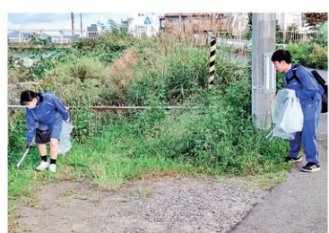
▲荒川クリーンアップ大作戦