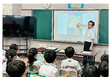
▲三河台小学校へ出前講座