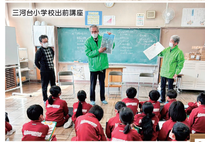
三河台小学校出前講座