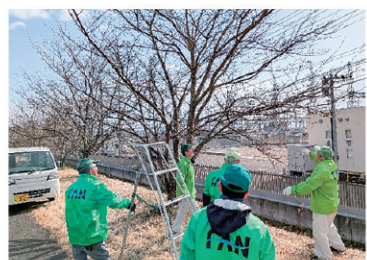
▲桜並木の枝せん定作業

定期総会 日時:4月24日(金)午後1時30分 場所:福島市吉井田支所 役員会 毎月第2水曜日 午後1時30分 場所:荒川資料室 その他 必要に応じて行事等打合せ会議等を開催する。