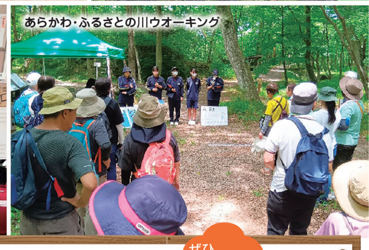
あらかわ・ふるさとの川ウオーキング